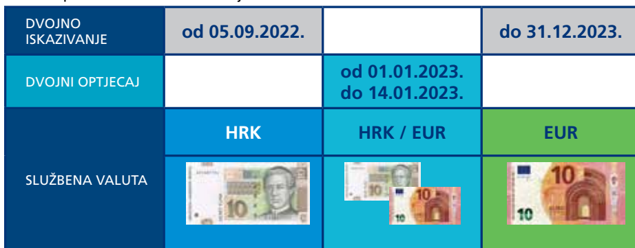
Grafički prikaz navedenih razdoblja

Od 1.siječnja.2023. službena valuta u RH postaje EUR.